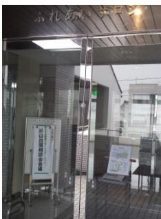
つやまサテライト入口