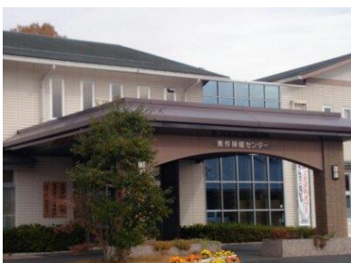
美作保健センター外観

美作出張相談会 （美作保健センター内） 住所 美作市北山390-2 毎月第4木曜日（祝祭日の場合は前後の週の木曜日に開催します） 11:00-16:00（予約制） ご予約は美作保健センター0868-75-3913まで