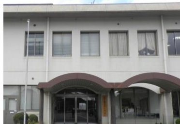
玉野市教育サポートセンター外観

玉野出張相談会 （玉野市教育サポートセンター内） 住所 玉野市玉原3丁目17-2 玉野市教育サポートセンター1階 毎月第4金曜日（祝祭日を除く） 13:00-16:00（予約制） ご予約はおかやまサポステ又は玉野市教育サポートセンター0863-33-5115まで