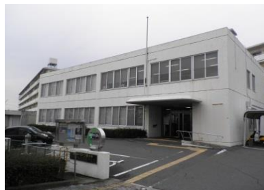
西大寺ハローワーク外観

西大寺出張相談会 （西大寺ハローワーク内） 住所 岡山市東区河本町325-4 毎月第3火曜日（祝祭日を除く） 13:00-16:00（予約制） ご予約はおかやまサポステ又は西大寺ハローワーク 086-942-3212まで