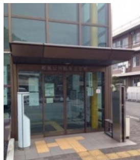
和気ハローワーク外観

和気出張相談会 （和気ハローワーク内） 住所 和気郡和気町和気481-10 毎月第3金曜日（祝祭日を除く） 13:00-16:00（予約制） ご予約はおかやまサポステ又は和気ハローワーク 0869-93-1191まで